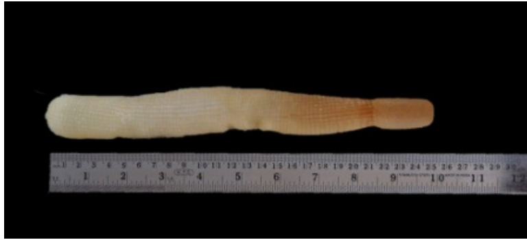
Gambar 1 Morfologi cacing laut Siphonosoma australe-australe

(HPLC), analisis kandungan asam lemak (AOAC 2005) dengan metode gas kromatografi, dan analisis mineral pada cacing laut (natrium (Na), kalsium (Ca), kalium (K), magnesium (Mg), natrium (Na), fosfor (P), timah (Pb), dan cadmium (Cd)) menggunakan spektrofotometer serapan atom (SSA).